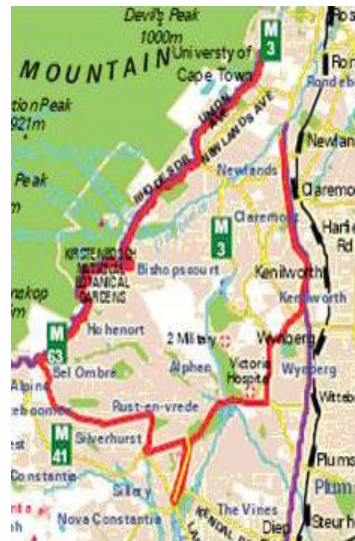
Strecke (Course map) Halbmarathon 21,1 km