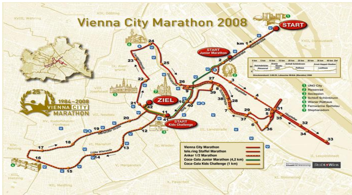
Strecken- bzw. Höhen-profil Wien Marathon & Halbmarathon